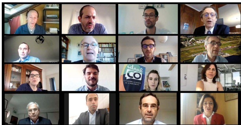
Capture d'écran du webinaire

cherche, les disciplines d'études et les acteurs portuaires.